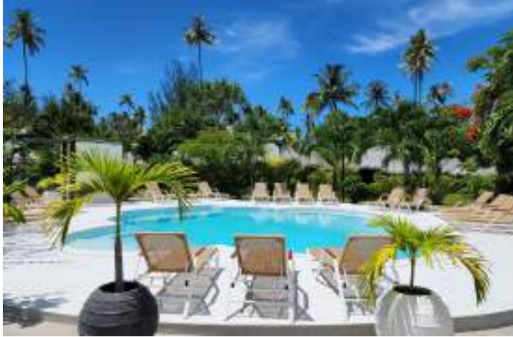
Espace piscine rénové en 2025