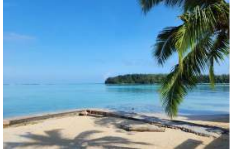
Lagon turquoise pour faire du snorkeling